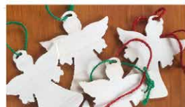
Vente d'anges de Noël