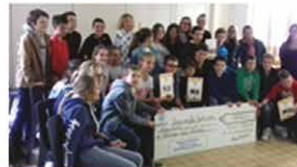
Envoi de cartes postales